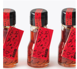
石井農園のエゴマラー油