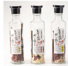
唐辛子ポン酢、辛々にんにく塩、餃子のたれの素