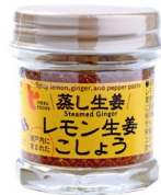
レモン生姜こしょう